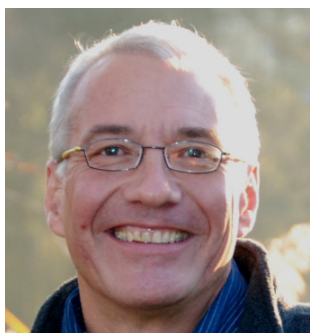
Leitung: Albert Pfister

Auch als Zuschauer, „Stellvertreter“ oder Schnuppergast - ohne eigene Aufstellung - werden wir von den Themen der anderen berührt. Die eigenen inneren Prozesse arbeiten mit und kommen dadurch wieder ein Stück weiter vorwärts.